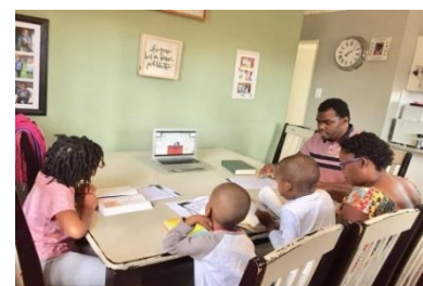
gebedsdienst thuis volgen