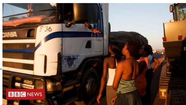
seks werkers bij de grensovergang van Nakonde