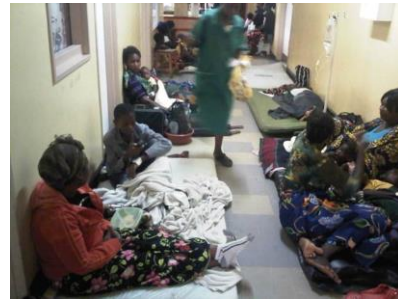
Arthur Davison Children Hospital