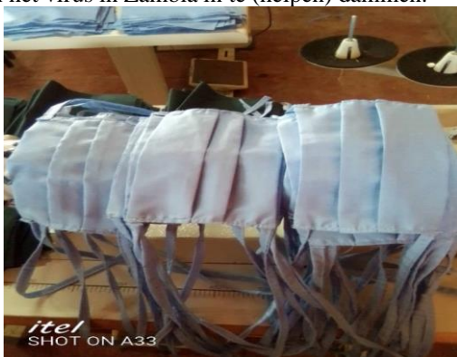
mondmaskers voor lokale gemeenschap

Minimaal twee bij Platform Zambia aangesloten stichtingen hebben geld beschikbaar gesteld om de verspreiding van het virus in Zambia in te (helpen) dammen.