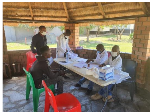
health workers in beschermende kleding

De stichting 'Geef de kinderen van Mpongwe' financiert een project in Mpongwe om voor de gemeenschap, het ziekenhuis en de scholen in Mpongwe 30.000 mondkapjes te maken. Het naaiatelier van het George Korsten Vocational Training College is eind april gestart met het maken van de door de regering van Zambia verplicht gestelde mondkapjes om bij publieke plaatsen zoals bussen, op markten en bij kerkdiensten te dragen. Er ligt een aanvraag bij het Wilde Ganzen Corona Fonds voor een aanvulling van de gelden met 100%.