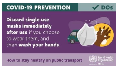
poster t.b.v. openbaar vervoer

Er zijn twee patiënten in Chingola ontdekt. Het echtpaar was voor zaken in Tanzania geweest, verbleef 3 dagen aan de grens bij Nakonde (Noord Zambia) om hun goederen in te klaren en reisde met openbaar vervoer door naar huis. Ze zijn in quarantaine geplaatst.