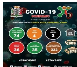
stand op 24-4