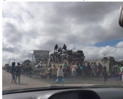
Mterere Market Lusaka