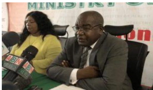
Dr Chilufya tijdens een persconferentie

De volgende dag zijn er weer twee nieuwe besmettingen vastgesteld in de stad Kafue. Het hele district wordt afgesloten, gezondheidswerkers gaan twee dagen van huis tot huis om iedereen met koorts te testen.