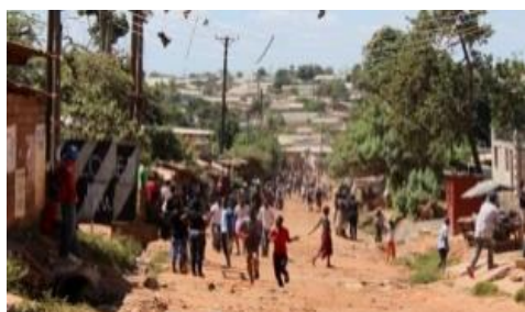
Compound in Lusaka

Omdat er in de afgelopen dagen geen nieuwe besmettingen geregistreerd werden, wordt de totale Lock down in Kafue opgeheven.