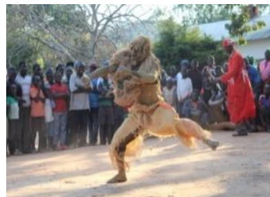
Traditionele Chewa danser