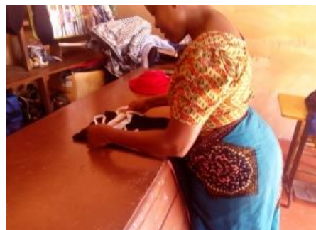
Lokaal gemaakte mondkemmers

Op 17-4 zijn er toch weer nieuwe patiënten geregistreerd: 1 in Kafue en een in Lusaka uit Bauleni Compound. Beide zijn contactpersonen van de patiënten in Kafue. In het Mahatma Gandhi Hospital van Kabwe wordt een 10 jarig meisje fors benauwd opgenomen, zij was op bezoek geweest in Lusaka. De teller staat nu op 52 besmettingen, 30 patiënten zijn inmiddels genezen, 20 verblijven nog in isolatie.