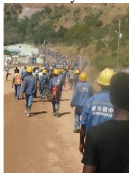
Syno Hydro Workers bij Kafue dam