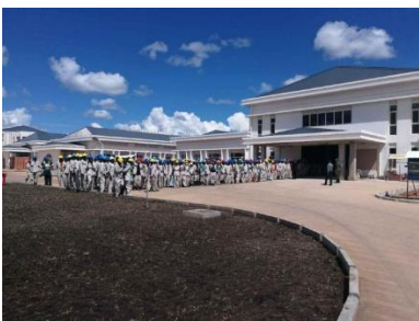
Petauke Gen. Hospital mrt 2019

In Petauke is een gloednieuw ziekenhuis stand by voor de opvang van eventuele patiënten met Corona.