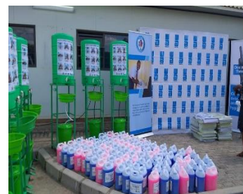
Officiële berichtgeving van het MoH