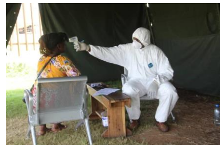
screening met beschermende kleding